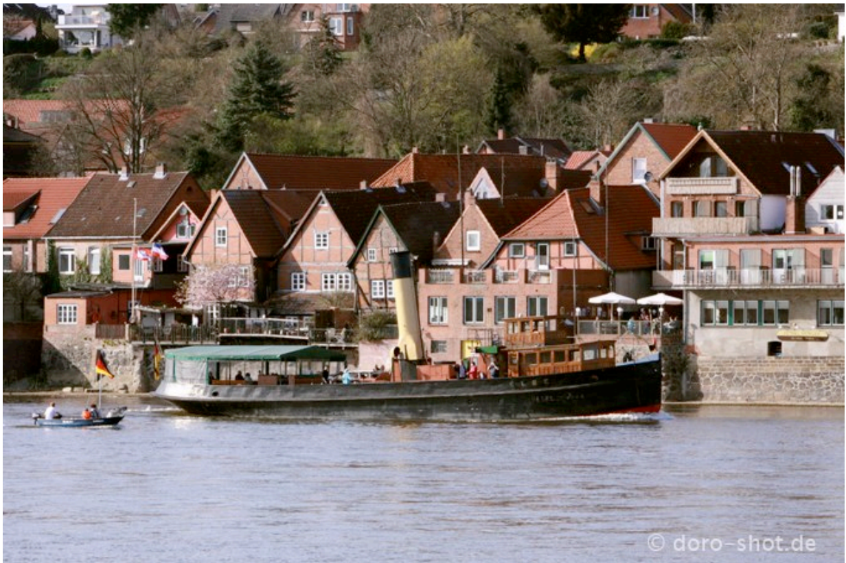
Dampfeisbrecher ELBE erreicht die alte Schifferstadt Lauenburg mit seiner malerischen, direkt am Elbstrom gelegen historischen Altstadt.